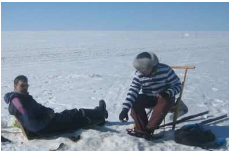
Kuvasta löytyy päivän suurin siika (se ainoa).