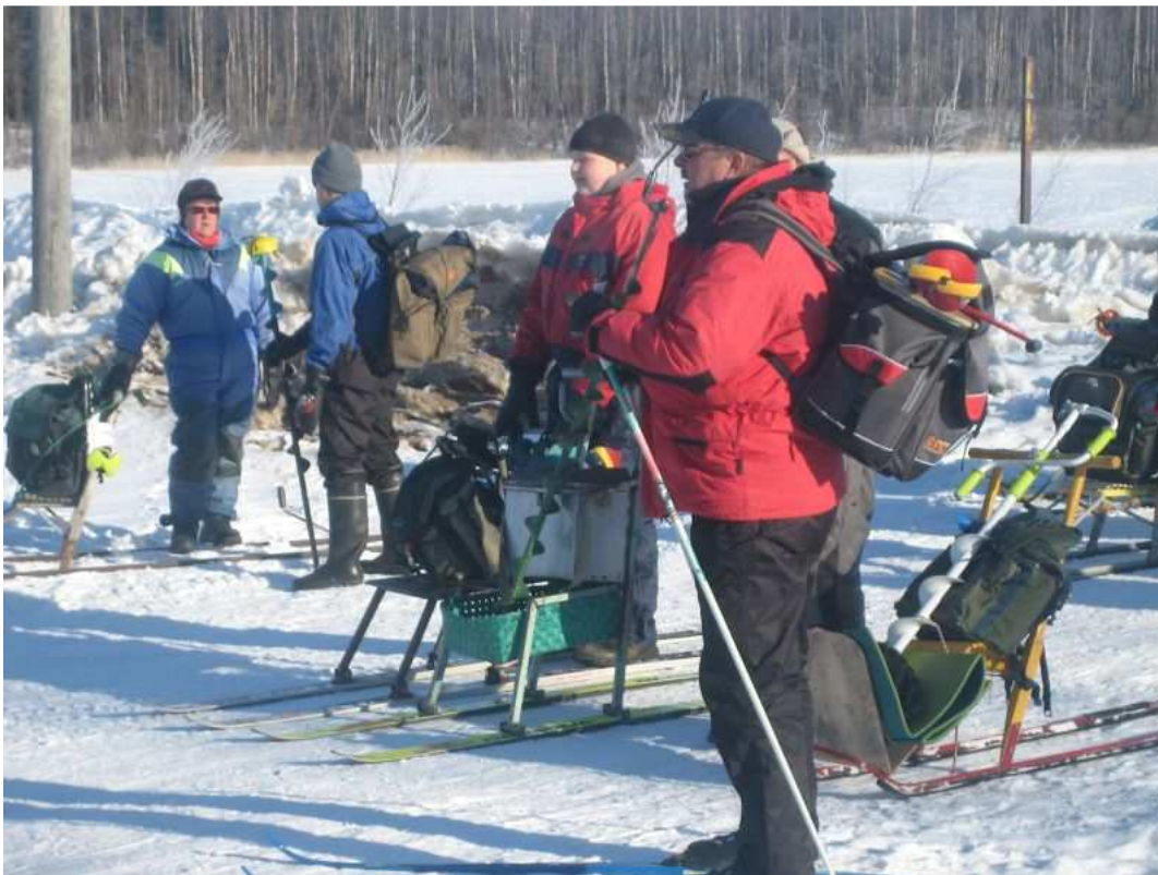
Keli kantoi monenlaista potkuria ja suksimiehet.